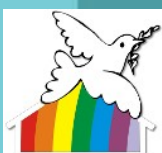
Friedenszentrum Braunschweig e.V.

Friedenszentrum Braunschweig e.V. und Braunschweiger Friedensbündnis Goslarsche Straße 93 • 38118 Braunschweig Tel. 0531. 89 30 33 • kontakt@friedenszentrum.info